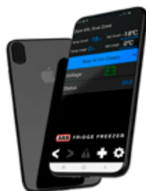
Aplikace pro lednici zdarma

Lednice ZERO se dodávají ve velikostech 36, 44, 60, 69 a 96 litrů.